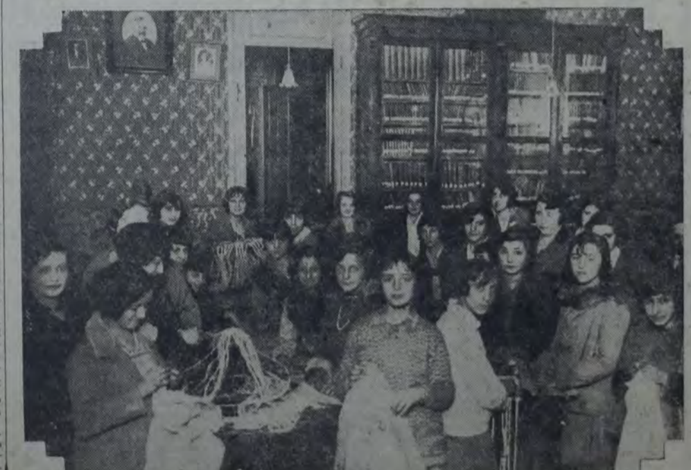
LAS ALUMNAS DEL CURSO DE CORTE Y CONFECCION