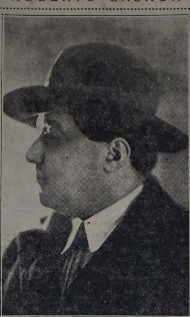
EL ESTIMABLE ACTOR QUE AYER CELEBRO EN EL NUEVO SU función de honor